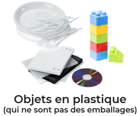
Objets en plastique (qui ne sont pas des emballages)